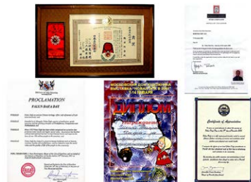
来自世界各地的褒奖 日本、俄国、澳大利亚和新西兰