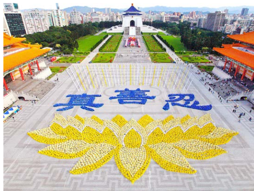
台北自由广场排字

Waldron有时还为美国政府提供咨询，并是美国国会中美经济和安全评估委员会的创始成员之一。