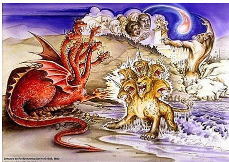
圣经《启示录》中的“古蛇”暗示中共