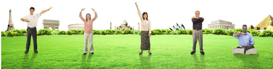
第五套功法 神通加持法