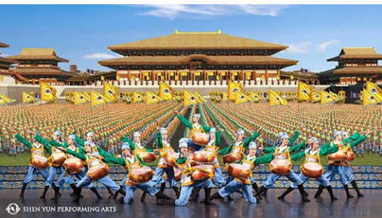
神韵艺术家展现全新的中国

法轮大法已弘传100多个国家和地区，受到世界人民的爱戴和尊敬。李洪志先生和法轮大法因对人类身心健康做出的杰出贡献，获各国政府褒奖、支持议案和信函3500多项。《转法轮》已有40种文字版本并可在法轮大法网站www.falundafa.org免费下载。