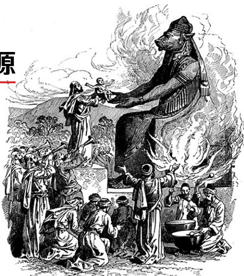
Moloch (土星) 活祭婴儿