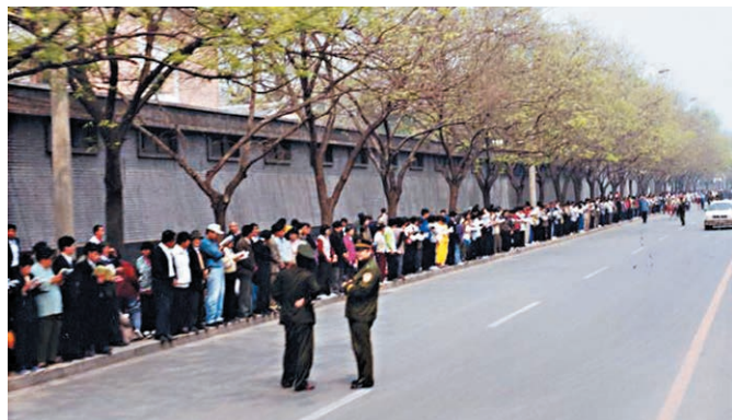
秩序井然的「四二五」上访民众