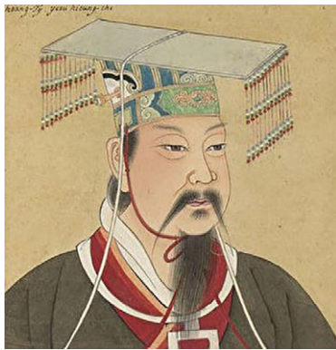
黄帝像，出自《Portraits de Chinois celebres》（《历代帝王圣贤名臣大儒遗像》），18世纪绘制，法国国家图书馆藏。

中国，古称神州，神的故乡。在创世主系统有序的安排下，展开了一幅清晰的历史画卷：盘古开天地，女娲造人，巢氏构木为巢，燧人氏钻燧取火，伏羲创世画八卦，神农尝百草，教会人适应环境、如何生活。时光来到了黄帝时代，中华历史