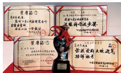
93年东方健康博览会