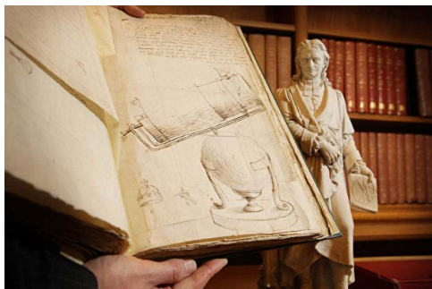
牛顿手稿在伦敦皇家学会展示