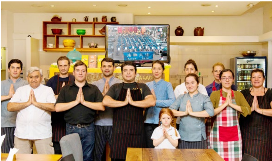
餐厅的员工们在 2018 年法轮大法传世 26 周年之际感谢师父