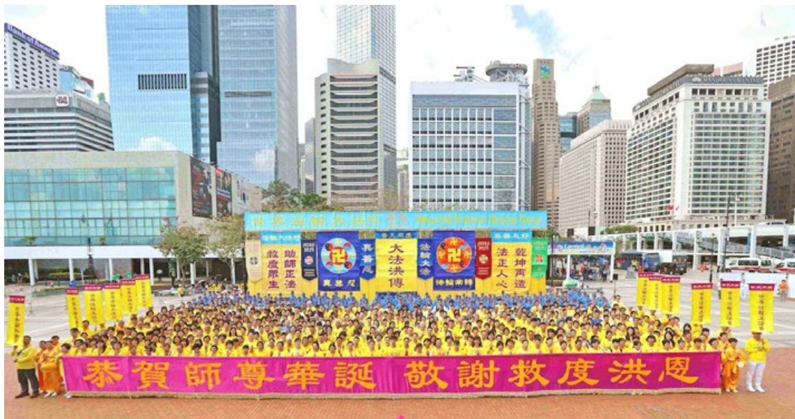
香港中环爱丁堡广场上的集会，庆祝法轮大法传世 26 周年。