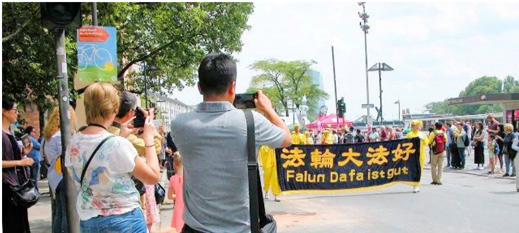
德国法兰克福文化节，民众拍摄法轮功队伍。（2018年6月16日）