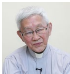
天主教香港教区荣休主教陈日君枢机

天主教香港教区荣休主教陈日君枢机表示，法轮大法有益于身体健康，香港和世界其它国家地区都有很多人学炼法轮大法。很可惜在中国大陆发生对法轮功的迫害，他说：“我们很欣赏法轮功学员都是以非常和平理性的方式坚持其良善的行动，世界上越来越多人欣赏法轮功为个人与社会带来的好处。”