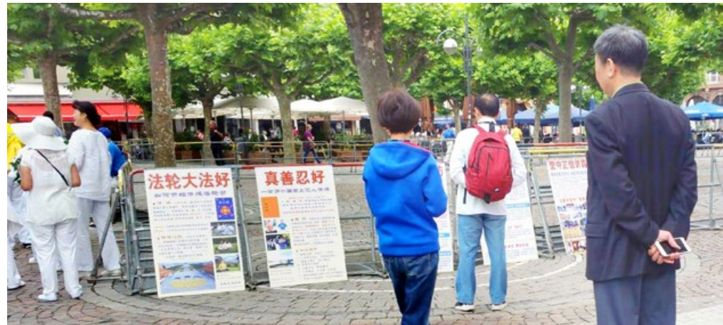
在法兰克福市中心，中国游客阅读法轮功真相展板。