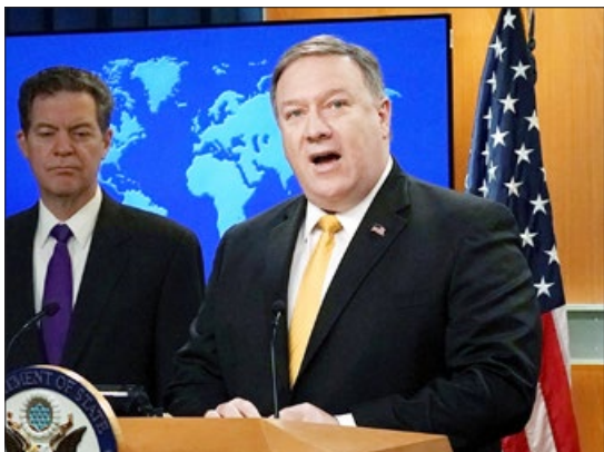
美国国务卿蓬佩奥在新闻发布会上

【明慧网】2018年5月29日，美国国务院发布2017年度《国际宗教自由报告》，中国再次被列为“特别关注国”。报告关注法轮功、基督教等信仰团体受迫害情况。美国国务卿蓬佩奥表示，美国对于侵犯宗教自由的行径不会袖手旁观。