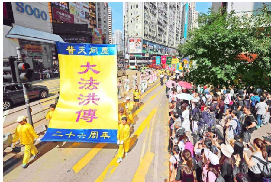
香港大游行，沿途民众深受震撼。