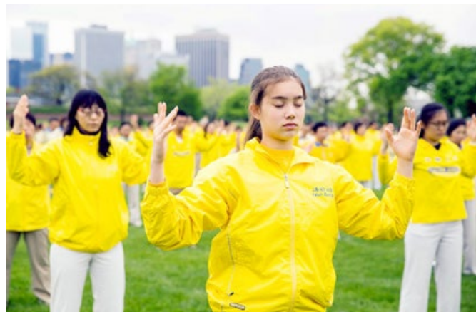
参加排字活动的法轮功学员，在纽约总督岛炼功。