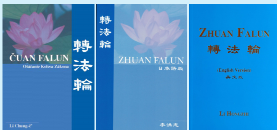
↑ 《转法轮》斯洛文尼亚文版、日文版、英文版封面

“天梯书店”有售：《转法轮》已被翻译成 40 种语言，是迄今为止翻译成外国语言文字最多的中文书籍，在世界各地的法轮大法书籍专营店“天梯书店”都可看到。