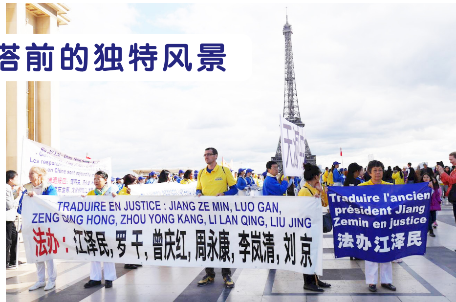
↑ 法轮功学员艾菲尔铁塔前集会