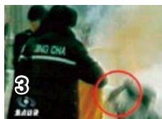
3 刘用手触摸被击打部位，随之倒地