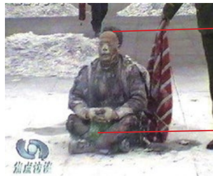
警察晃着灭火毯等镜头