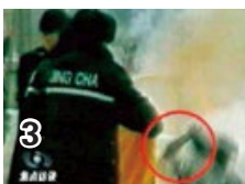
刘用手触摸被击 打部位，随之倒地