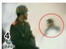
镜头右转，摄下了 袭击位置的男子