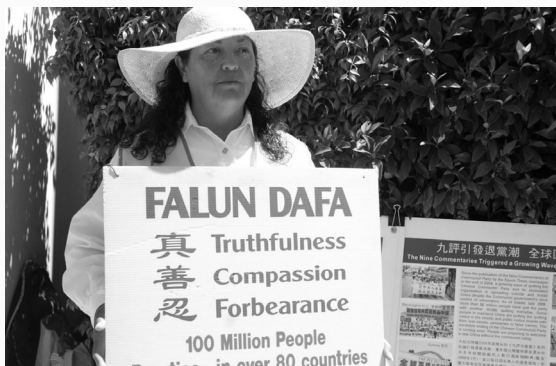
36 人之一：澳大利亚 莫娜

► 经济师伊万娜听到瑞典几个学员要去北京的消息，她没有丝毫的犹豫就决定了：“我去！”