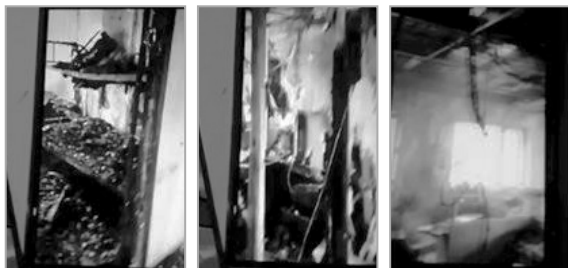
两边被烧毁的房间

这起火灾是电火引起的，发生在办公楼的第三层，整个楼层被烧个精光；大火也殃及了二楼。二层楼的一间间办公室连门都烧得一点不剩。现场一片狼藉。唯独有一间办公室，门是木门，却安然无恙，甚至都没有被熏黑，里面的家具，桌、椅、柜和窗户几乎都完好无损。