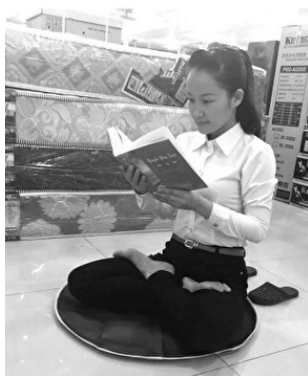
After a period of hesitation, I decided to read Zhuan Falun, the main book of teachings of Falun Dafa. Then I began to practice and I experienced many positive changes in my health.

就这样，我开始修炼法轮功。在炼功和读书的同时，我的身体得到净化。一开始，我比以前更加频繁地腹泻，疼痛加重。因为书中提到了这些，我相信书中所写的，继续炼功。书中也强调按照“真、善、忍”修炼