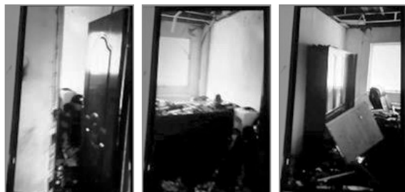
门与家具完好的房间