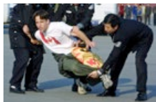
36 人之一：加拿大 泽农

呼啸而来之前，玛丽昂一直都认为，他们可以和平地打完横幅之后就走。但在之后的一天时间里，她见证了中共的残暴。