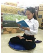
After a period of hesitation, I decided to read Zhuan Falun. In the course of readings of Falun Dafa, I began to practice and I experienced many positive changes in my health.