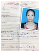
The writer has breathing and swallowing problems due to a tumor in the nasopharynx, the upper throat that lies behind the nose. This is a photo of her at the time, pale and weighing less than 82 pounds.

因为病痛，我再也无法睡一个好觉，因为需要改变原来习惯性的睡姿，否则，我可能因为肿瘤部分阻挡了气管而窒息。我的鼻咽部有肿瘤，