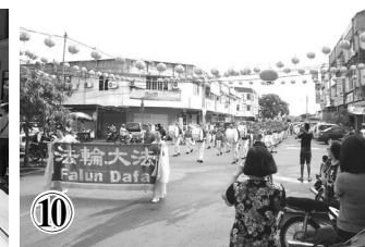
④—⑨美国纽约、旧金山法轮功学员庆祝中国新年大游行。⑩马来西亚法轮功学员庆祝中国新年大游行。