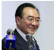
张凯臣，前沈阳市市委宣传部联络部长。