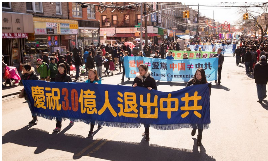
2018年3月11日，美国纽约法轮功学员布鲁仑大游行。

有人可能说“自己心中退党就算退了，不必声明”；还有人认为“自己多年没交党费了，就算自动退党了”；或者认为“年龄大了，已经自动退团、退队了”。但这都无法解除加入中共时发下的毒誓。而天灭中共时，没有解除这个毒誓的人，就将成为中共的陪葬。只有采取公开的方式退出，有行为的表示，才能解除那个“毒誓”。神看人心，只要真心声明“三退”，用真名、化名、小名皆可。