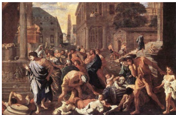
画家描绘的瘟疫（1630 年，法国画家 Nicolas Poussin）

古罗马帝国，强大无比，在小小病毒的折腾下落幕；迫害基督徒的古罗马帝王们，皆以厄运终结。历史如一面镜子，映照着一个不争的事实：迫害正信，必遭天惩。历史也正在重演，中共迫害正信，也必遭天惩，如何能在天谴中免于被中共捆绑连累，每个中国人当深深思之！