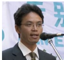
陈用林，原中共驻悉尼领馆负责监控法轮功的外交官。