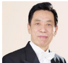
关贵敏，著名男高音歌唱家，中国“歌王”。