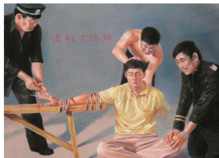
中共酷刑图示：用竹签扎手指