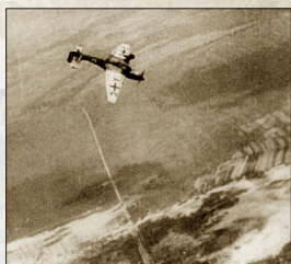
德军 Ju 87B “斯图卡俯冲轰炸机”轰炸色当周围的法军阵地

德军很快在比利时与法国交界的色当撕开了法军的防御线，迅速南下，绕到马其诺防线的背后。6 月 14 日，德军占领法国巴黎。