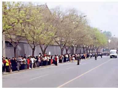
▲ 上访现场，秩序井然。

“四二五”和平上访，起因是中共江泽民集团不断制造事端，蓄意迫害法轮功：从1996年非法禁止出版法轮功书籍，到江泽民、罗干一伙扣押国务院总理对法轮功的正面批示；从1998年公安部四处派特务收集法轮功的“罪证”未果，再到动用公安强行驱散炼功群众，非法抄家……三年中，打压不断升级。最后终于由警察殴打及非法抓捕四十多名法轮功学员的天津事件，引发了1999年4月25日万人和平上访。法轮功学员上访，维护的是按“真善忍”做好人的权利，无关政治。◇