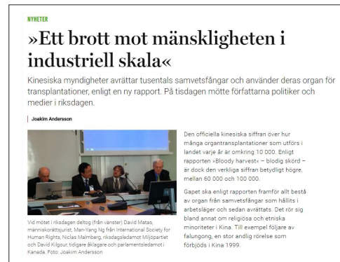
▲ 瑞典《医生报》专题报导“工业化大规模反人类罪”的网页截图