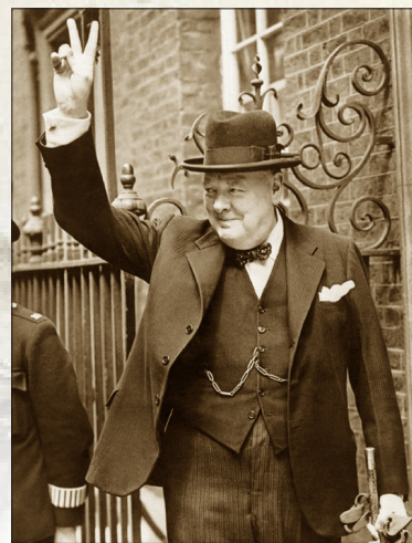
1940年5月20日，丘吉尔任英国首相十天后，德国军队到达英吉利海峡。面对严峻形势，丘吉尔以V字形手势，向民众传达正义必胜的信心。

回顾二战的历史，其中有几件相似的事情：战争爆发之前，英法两国对纳粹采取绥靖政策，苏联共产党政权与纳粹沆瀣一气。这无疑成了希特勒发动二战的必要条件。而这些国家直到大祸临头才清醒，但为时已晚，他们曾经占有的巨大军事优势在姑息、妥协和同流合污中迅速瓦解，他们面对的是强大的敌人和前所未有的困境。这些国家在纵容邪恶时所获得的利益，也在战争一开始就付诸东流。