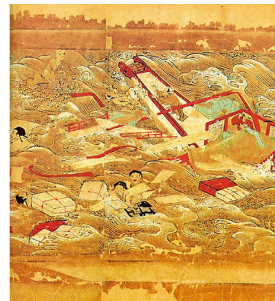
右图：《东征传》绘卷局部，鉴真东渡途中在狼沟浦遇险。

胁。在他的大弟子祥彦和日本僧人荣睿因病去世、他自己也身毒入眼、双目罹疾致失明、并且五次东渡失败之后，他还是坚定地扬帆起航，开始第六次征程。鉴真说过“是为法事也，何惜身命”。