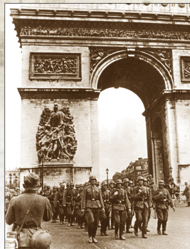
德军占领法国巴黎后进入凯旋门