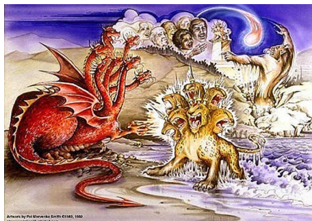
圣经《启示录》中的“古蛇”暗示中共