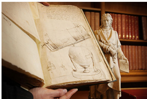
牛顿手稿在伦敦皇家学会展示