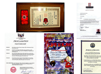
来自世界各地的褒奖 日本、俄国、澳大利亚和新西兰

法轮大法也称法轮功，是由李洪志先生于1992年5月传出的佛家上乘修炼大法，以“真、善、忍”为根本指导，包含五套舒缓的功法动作。