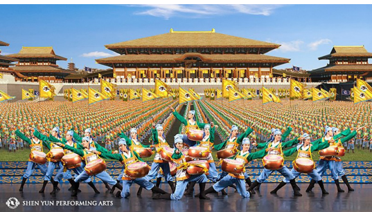
神韵艺术家展现全新的中国