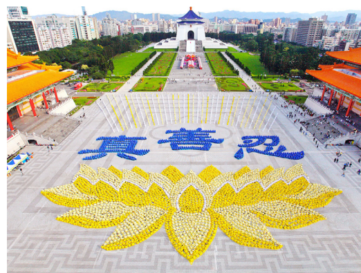
台北自由广场排字