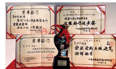
93年东方健康博览会