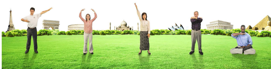
第五套功法 神通加持法

道德教化百姓，渐渐社会安宁，百姓生活幸福，有熊国变得非常强盛，诸侯不断归附于他。