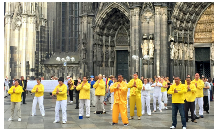
▲ 2017年6月25日，德国法轮功学员在科隆大教堂前炼功

德国西部城市科隆是旅游胜地，尤其是科隆大教堂是中国游客必游之地。这个莱茵河畔的美