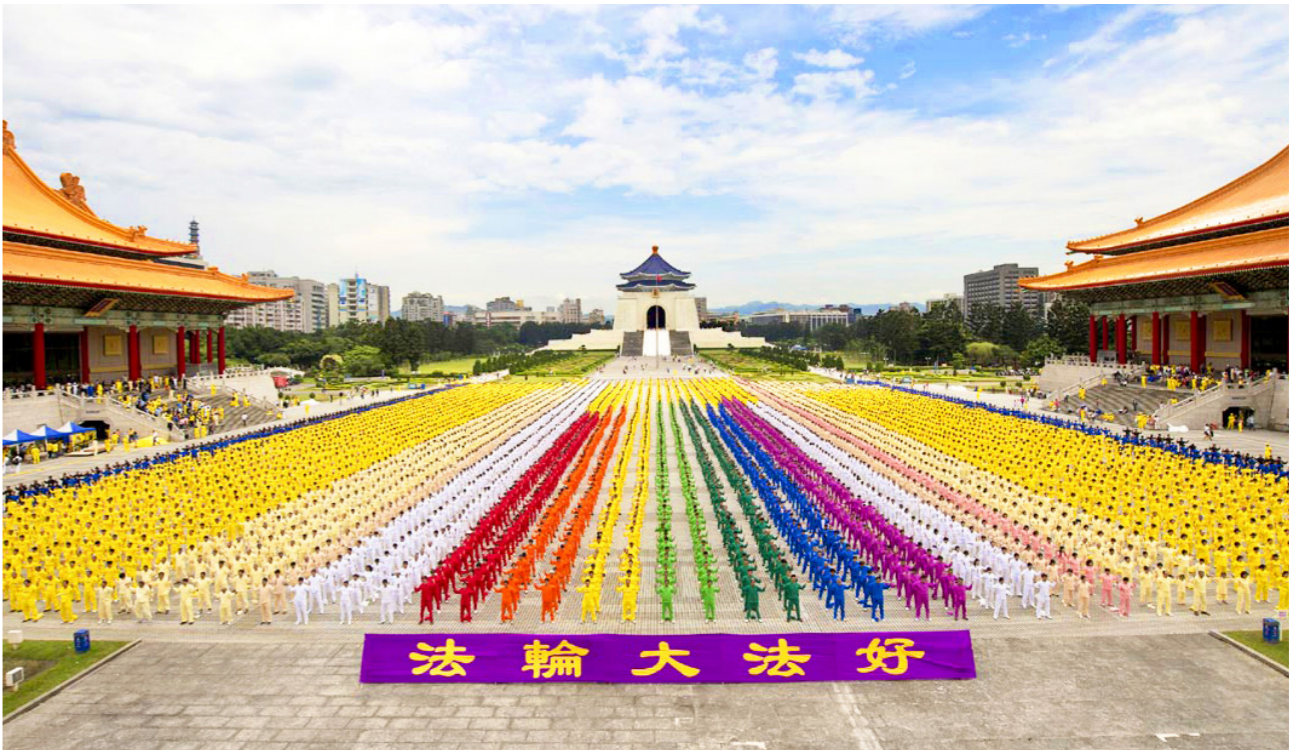
▲ 约 7400 名法轮功学员在台北自由广场集体炼功