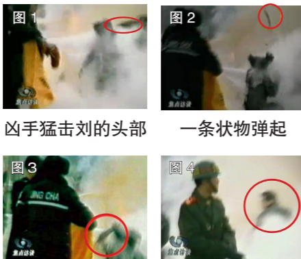
凶手猛击刘的头部