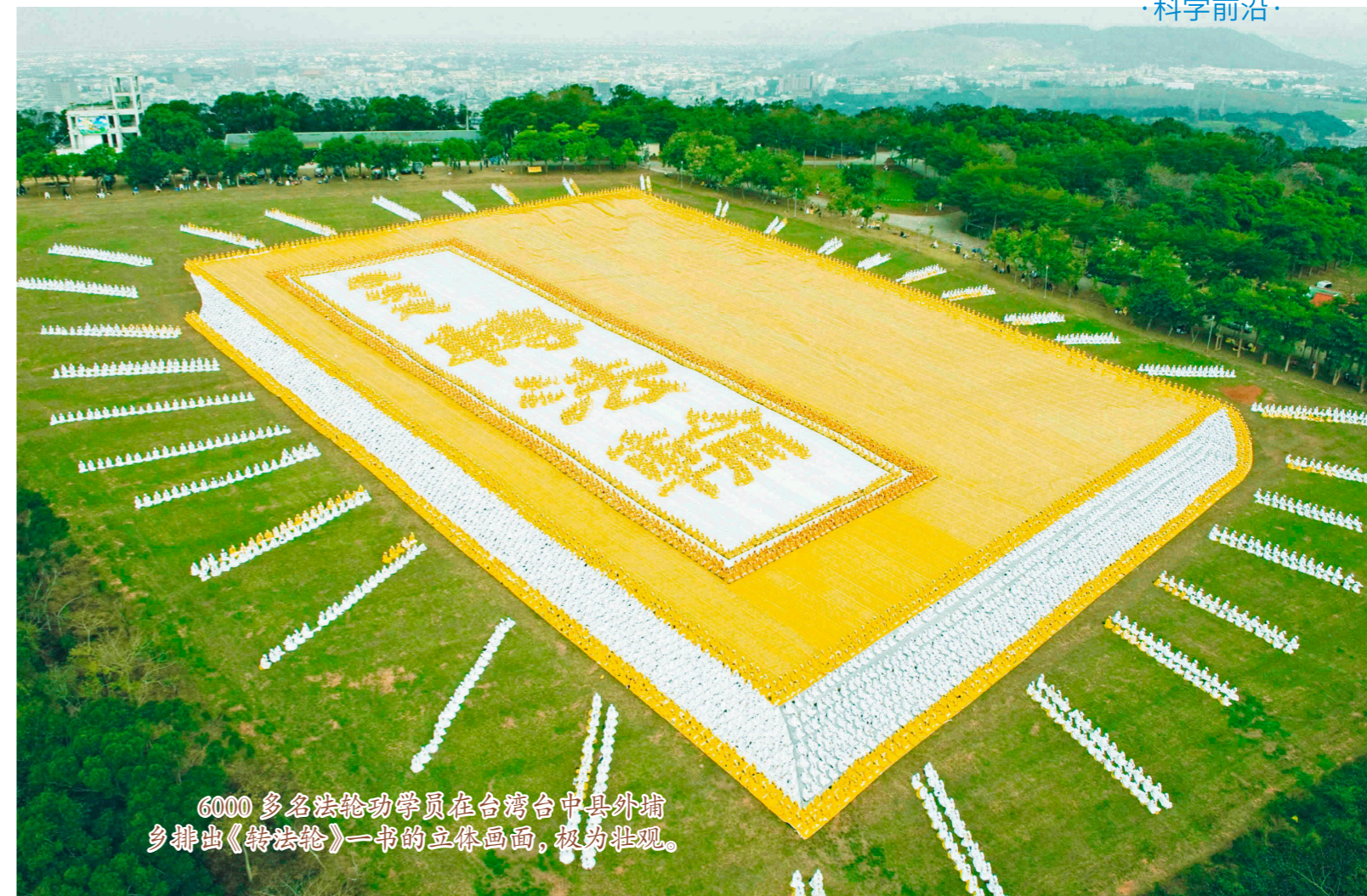
6000多名法轮功学员在台湾台中县外埔乡排出《转法轮》一书的立体画面，极为壮观。

可通过翻墙软件浏览明慧网（ www.minghui.org ），了解更多关于“天安门自焚”伪案的事实真相。（网络翻墙方法见封底）