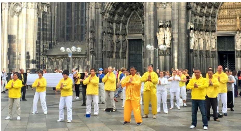
▲ 2017年6月25日，德国法轮功学员在科隆大教堂前炼功

德国人多数都有信仰。1997年8月，德国《玄奥》杂志发表了一篇介绍法轮功的文章，从此法轮功便走进了这个以严谨认真著称的国度。法轮功炼功点遍布德国各个城市，很多家庭都是全家人共同修炼法轮功。欧洲其他国家也是一样，欧洲共49个国家，法轮功已弘传至47个国家。