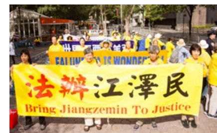
▲ 2016 年 9 月 20 日，纽约法轮功学员集会，声援法办江泽民。

善恶有报是天理。这些迫害法轮功的人权罪犯们，将面临惩罚与恶报，停止迫害、将功赎罪是他们的唯一出路。◇