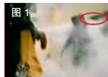
图 1 凶手猛击刘的头部