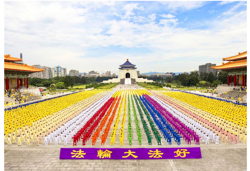
▲ 约 7400 名法轮功学员在台北自由广场集体炼功

因害怕谎言被揭穿，中共江泽民集团烧毁法轮功的书籍，关押讲真相的大陆法轮功学员，封锁海外明慧网等报道真相的网站。但是中共的谎言无法阻挡真相的传播。◇