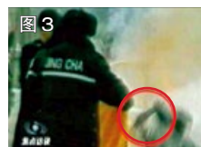
图 3 用手摸头，突然倒地