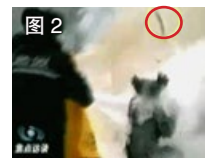
图 2 一条状物弹起