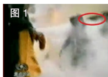
图 1 凶手猛击刘的头部