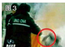
图 3 用手摸头，突然倒地