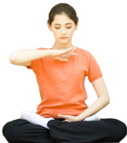
▲ 法轮功学员宁静祥和地炼第五套功法

霍金斯的研究从医学的角度告诉人们，意念真的是不可思议，意念对人的健康有着极大的影响。振动频率指数在 200 以上的意念通常有这样的表现：喜欢关怀别人、行善，有慈悲心、爱心，性格宽容、柔和，这些都是高的振动频率，有利于人的健康。可见，保持积极乐观的心态，多一些正面的念头，以及拥有一颗慈爱的心，是健康不可缺少的因素。可以说，人的健康与善良是成正比的。◇