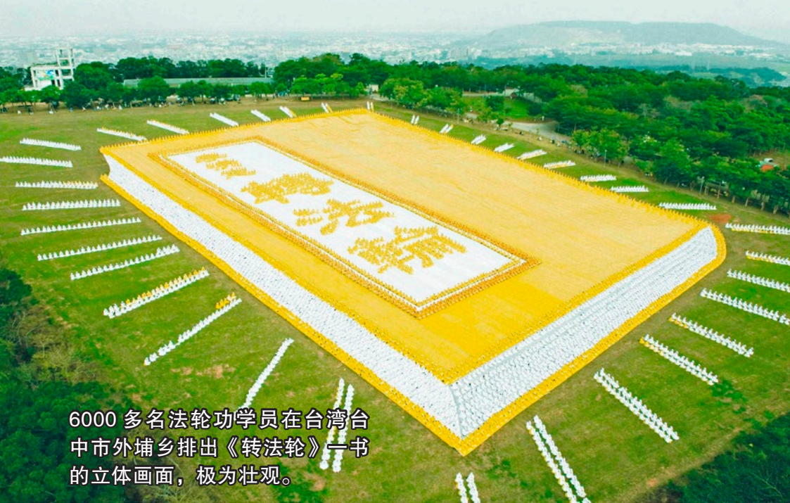
6000 多名法轮功学员在台湾台中市外埔乡排出《转法轮》一书的立体画面，极为壮观。

40 多万个样品，各个试验指数都是他制定下来的。而医生本人也看过上千个这类病例。