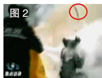
图 2 一条状物弹起