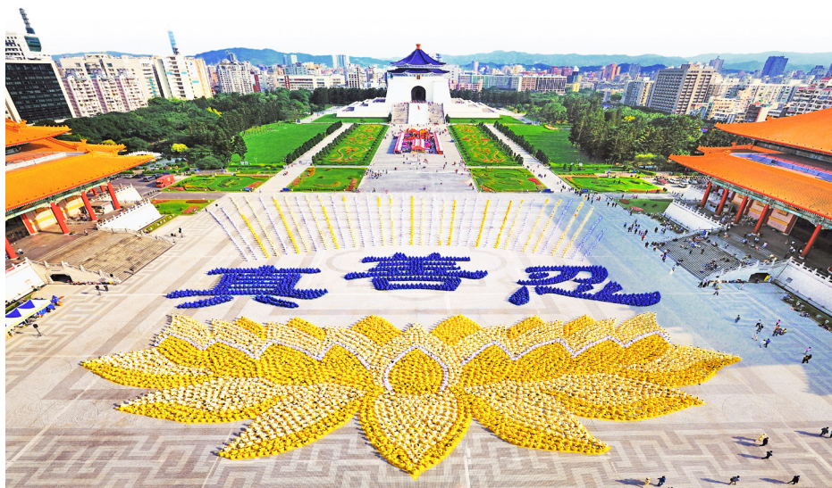
上图：5000 多名法轮功学员于台北自由广场，排出了莲花座和“真善忍”三个大字。