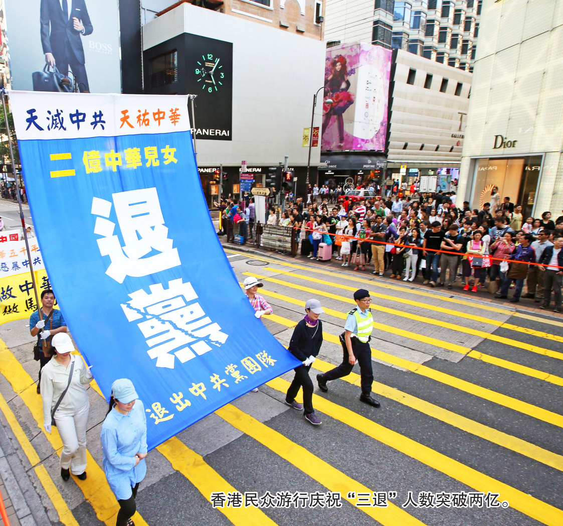
香港民众游行庆祝“三退”人数突破两亿。