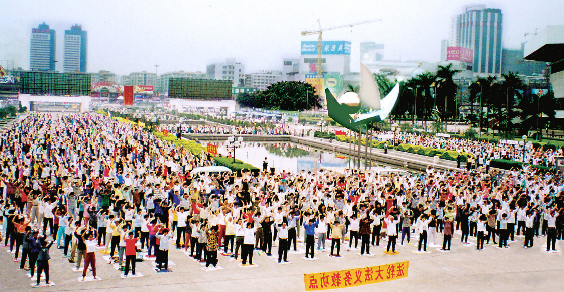
上图：1998 年，广州的一个法轮功炼功点的学员们在晨炼。