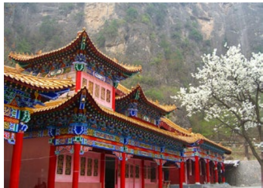
▲ 外观宏伟，景色优美的净影寺。

在今天的河南焦作市云河谷风景区内，有一座千年古刹——净影寺。据史料记载，隋朝开皇三年（公元583年），隋文帝感于慧远法师对佛教发展作出的巨大贡献，敕建净影寺，作为“佛门之都”青莲寺的下院，供慧远法师释义居住。