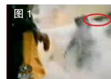
图1 凶手猛击刘的头部