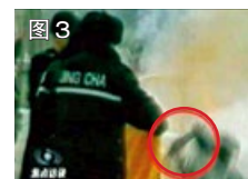
图3 用手摸头，突然倒地