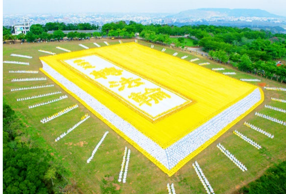
▲ 6000 多名法轮功学员在台湾台中市外埔乡排出《转法轮》一书的立体画面，极为壮观。

就在我读《转法轮》两个月后，整个都变了。腰也不酸了，关节也不疼了，什么心绞痛、偏头痛、脾虚胃疼的都好了，原来蜡黄的脸变得白里透红。我每天很开心很轻松，早上睡醒觉，都感觉自己像躺在棉花上一样，轻飘飘的。因此我很想说，“女强人”很喜欢“真、善、忍”，正因为修炼，才活得更洒脱了！◇