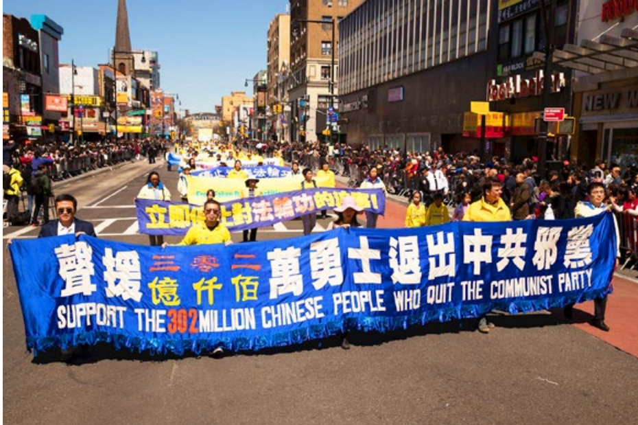
▲ 2018 年 4 月 22 日，大纽约地区上千名中西方法轮功学员，纪念“四·二五”并声援“三亿”人“三退”。