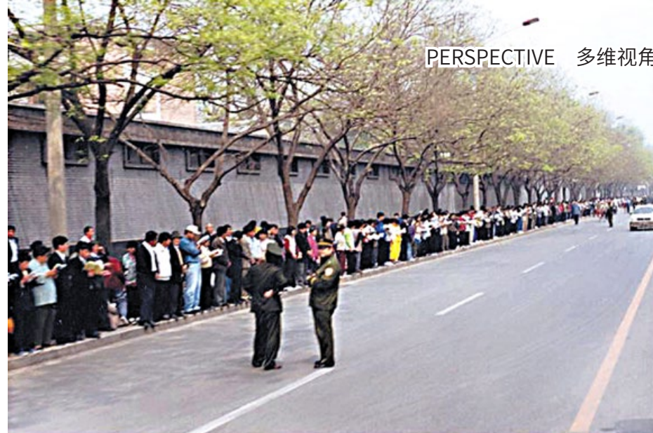
▲ “四·二五”上访现场，法轮功学员安静地站在府右街一侧，在场的警察悠闲地在聊天。

并命令其它报纸转载。随后，新闻出版署下发内部文件，禁止出版、发行法轮功书籍。由于修炼法轮功人数众多，一场迫害早已成山雨欲来之势。时任中共政法委书记的罗干命令公安系统在全国“秘密调查”法轮功，但却找不到打压法轮功的任何理由。