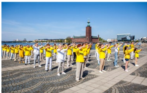
▲ 2018年5月12日，瑞典法轮功学员在首都以集体炼功的方式庆祝“世界法轮大法日”。