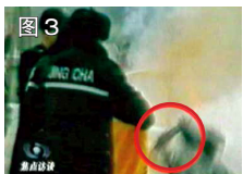
图 3 用手摸头，突然倒地