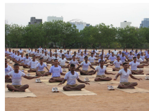
▲ 在印度教育界法轮功也广受欢迎，很多学校的校长修炼法轮功后，在体育课上教学生们炼功。伴随着炼功音乐，师生齐聚在操场炼功，场面宁静祥和。