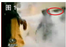
图 1 凶手猛击刘的头部