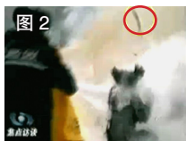
图 2 一条状物弹起