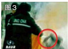
图 3 用手摸头，突然倒地