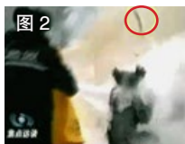
图 2 一条状物弹起