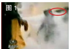
图 1 凶手猛击刘的头部