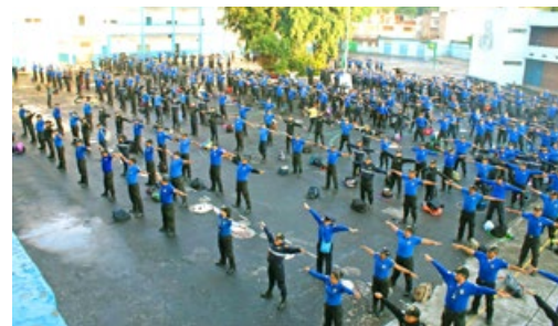
墨西哥六百名警察学炼法轮功（2016年7月）

一门专门介绍法轮大法修炼的课程，2016年9月7日在美国南卡罗莱纳大学艾肯分校正式开课。南卡罗莱纳大学在2016年《美国新闻与世界报导》的全国最佳大学排名中，名列美国南方区域性公立大学第一名。