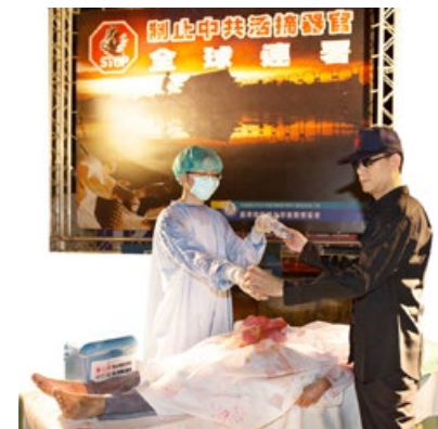
中共活体摘取法轮功学员器官演示

联合国特派专员弗瑞德·诺瓦克先生指出，2000～2005 年是法轮功学员被中共迫害最残酷时期，也是中国器官移植手术暴增阶段。