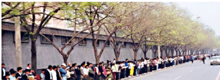
图：上访现场秩序井然，警察不用维持秩序，马路上机动车、自行车正常行驶。