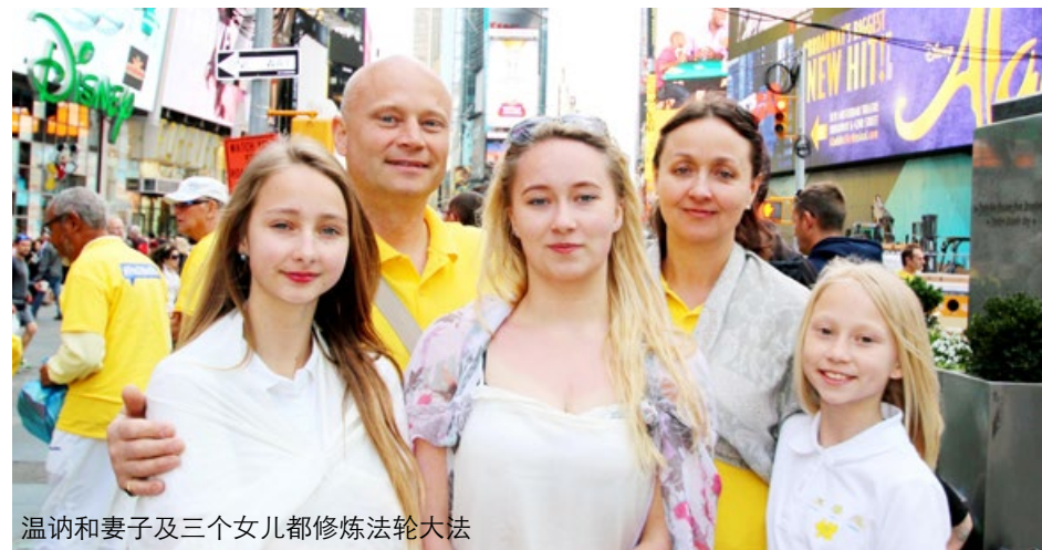
温讷和妻子及三个女儿都修炼法轮大法