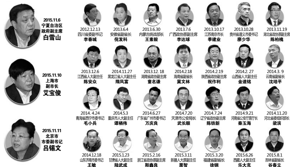
图：追随江泽民迫害法轮功的中共官员近年来纷纷落马