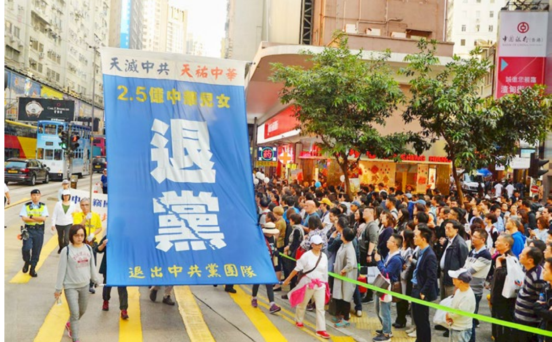
2016年12月10日国际人权日，香港法轮功学员大游行，声援2.5亿中国人“三退”（在海外网站发表声明，退出中共党、团、队组织）。

共产党作恶多端，却不许人们反对其作恶，也不许人们说出实情。因为一旦真相曝光，共产党就无法继续其“假恶斗”的特权。这是中共一贯用残酷手段禁止“反党”的根本原因。◇