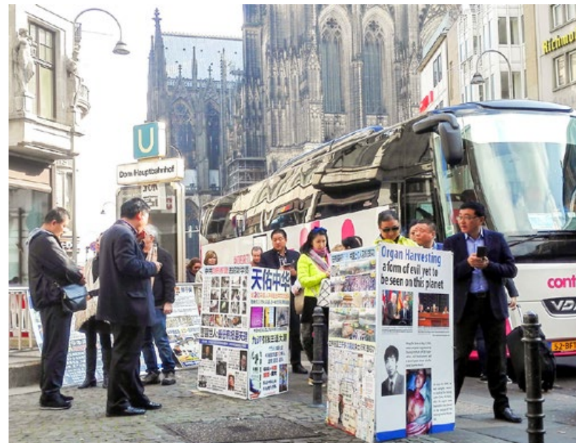
德国科隆大教堂前的广场上，中国大陆游客观看法轮功真相展板。

上天是慈悲的。加入中共党、团、队的绝大多数人，也是被欺骗的对象，或稀里糊涂地加入，或为生计、为有一个好的社会地位……在中共的党、团、队员中，有很多善良、正直的人，因此上天就要给