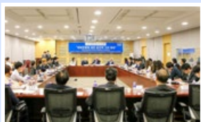
时间：2016.10.13 地点：韩国国会 议题：聚焦中共活摘器官暴行论坛