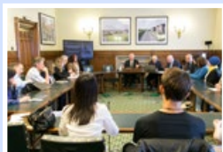
时间：2016.7.4 地点：英国国会 议题：中共强摘良心犯器官研讨会