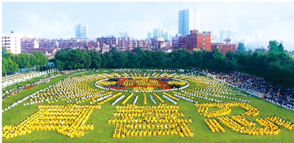
1997 年，5000 多名武汉法轮功学员炼功，列队组成法轮图形及“真善忍”。

当时的总理朱镕基对法轮功持开明态度。在 4 月 25 日的请愿中，他与法轮功学员代表见面，并指示释放天津被抓的法轮功学员。