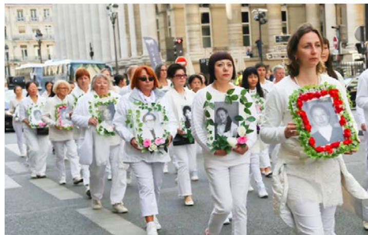
纪念被中共迫害致死的 4154 位中国大陆法轮功学员