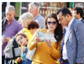
观众阅读法轮功 真相资料