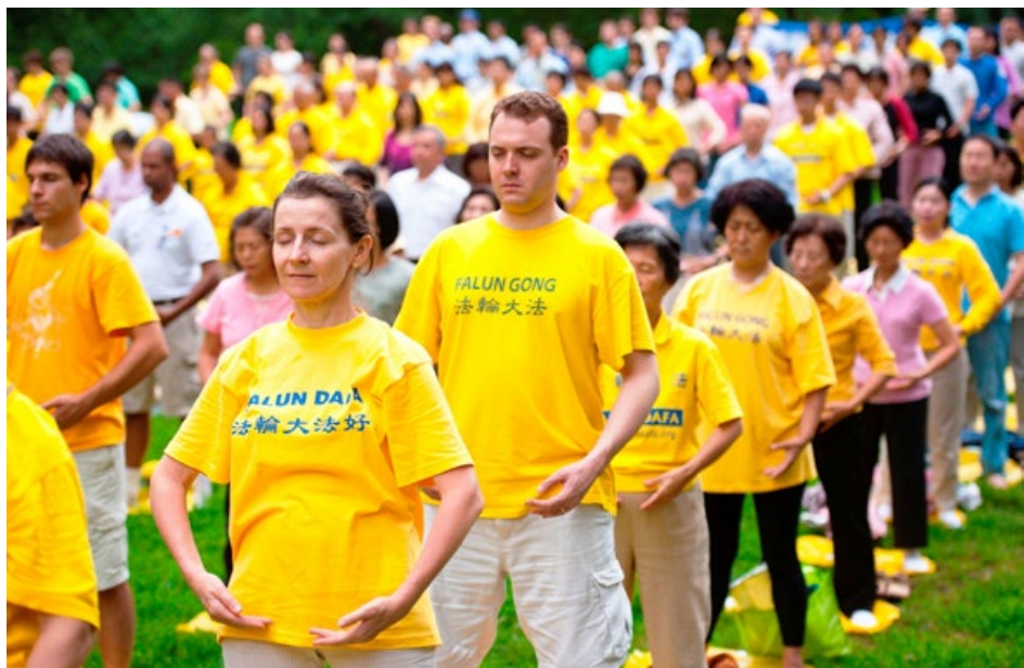
海外法轮功学员集体炼功

弘传世界 法轮大法已弘传 100 多个国家和地区，受到世界人民的的爱戴和尊敬。李洪志先生和法轮大法因对人类身心健康做出的杰出贡献，获各国政府褒奖、支持议案和信函 3500 多项。法轮功书籍被译成 39 种语言在全球出版发行并可在法轮大法网站上免费下载。◇