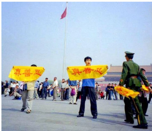
天安门广场一幕（2001年5月13日）

在法轮功被迫害初期，许多人到当地政府部门请愿。当他们看到低层地方官员毫无反应，就开始给更高层政府写信，或到北京请愿。到了2000年，几乎每天都有法轮功修炼者在天安门广场拉横幅、炼功，但多数人马上遭到逮捕。法轮功学员以非暴力应对迫害。他们尤其注重与警察和公众分享法轮功的真实信息。近年来，中国有越来越多的民众也加入了这些努力，包括人权律师。