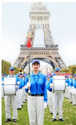
法轮功学员组成的 天国乐团