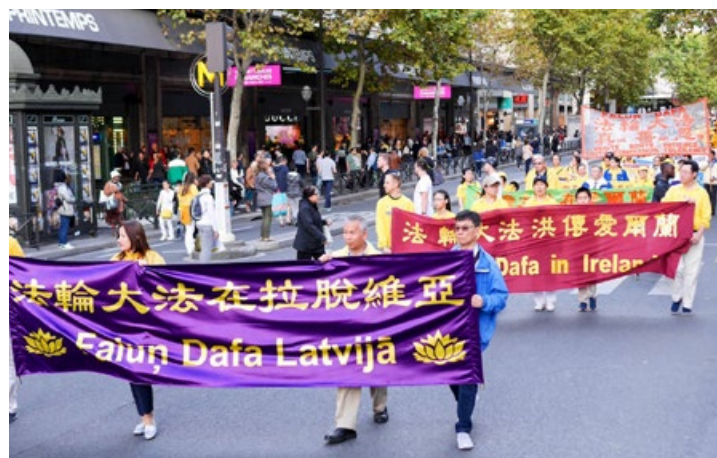
法轮大法弘传世界