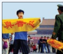
迫害法轮功 1999- 现在