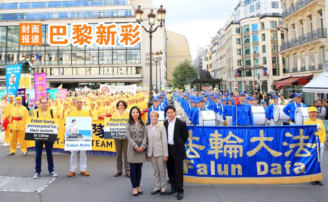
法国前部长奥斯塔丽女士（中）与法轮功学员合影