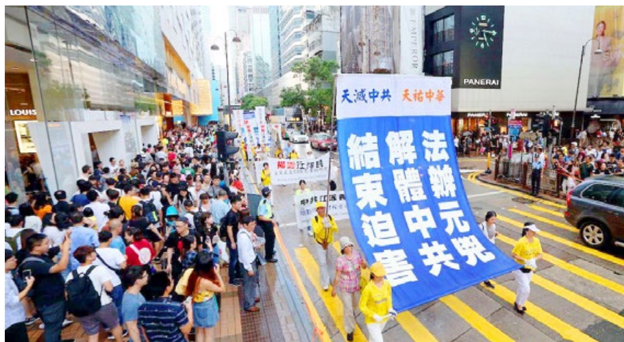
2017年10月1日，香港法轮功学员举行反迫害大游行。

使全国彻底腐败。政法委、‘六一零’非法组织常态化调动警力暴力迫害无辜民众，对修炼‘真善忍’的法轮功学员非法关押，制造大量冤假错案，引发天怒人怨。现在人们的生存环境，被江泽民及其培养的腐败官员全面破坏。人们吃的喝的是毒，穿的住的是毒，喘口气也吸毒，生活在无毒不在的环境中，不生病才怪呢。”