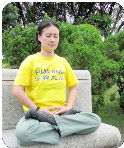
在纸醉金迷中找不到人生方向的雅惠，修炼法轮功之后获得健康的人生。

雅惠发现自己思想观念的尘垢被一层层剥落，身心越来越轻快，思想也越来越清净。她说：“从开始看《转法轮》，我就没有再想