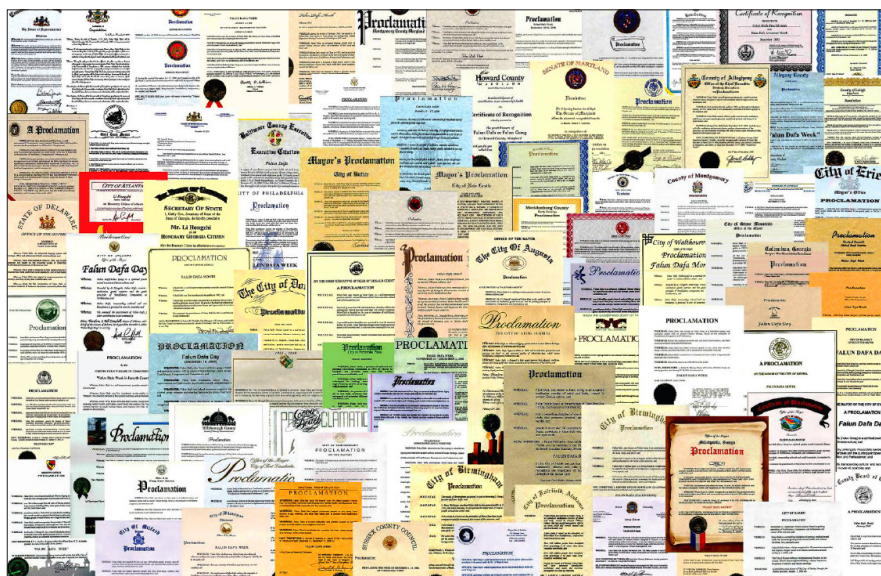
美国各级政府与政要往年给法轮功的褒奖