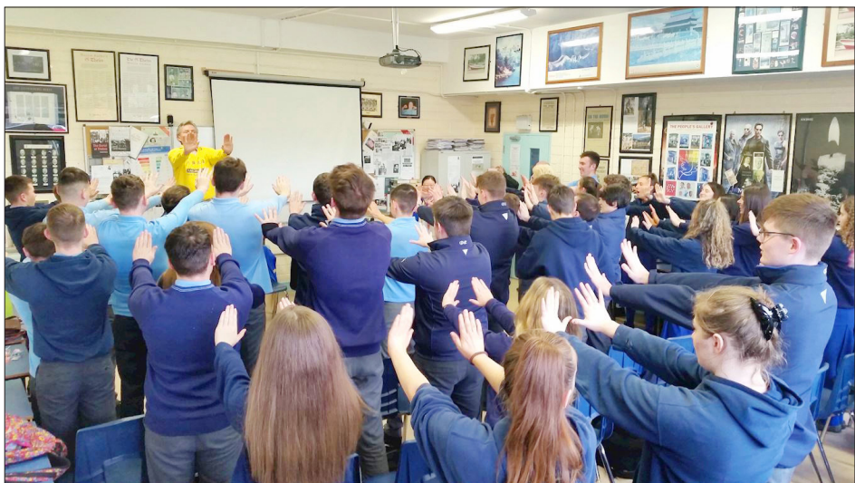
爱尔兰 都柏林 Malahide Community 中学将参加 2018 年高考的学生在炼法轮功。