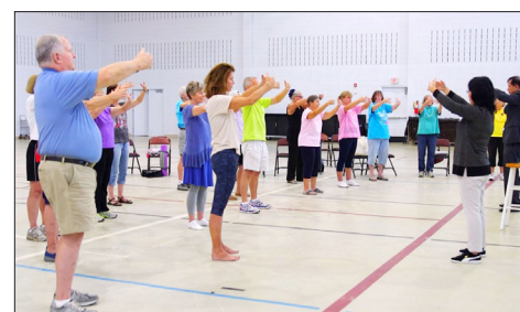
美国南卡罗莱纳大学艾肯分校成人班的学生在炼法轮功，左一是该校终身荣誉校长汤姆·豪尔曼博士。