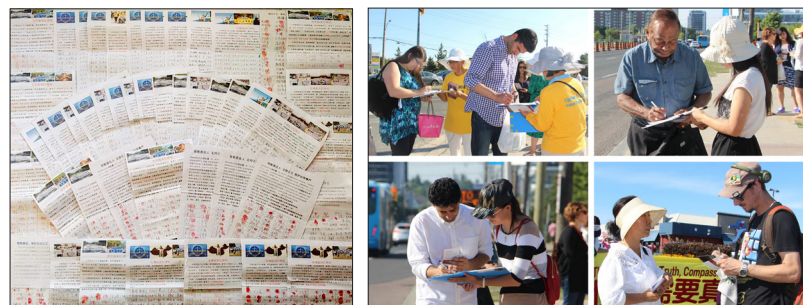
山东民众签名声援控告江泽民 加拿大多伦多民众签名支持法办江泽民