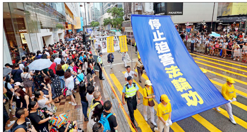
2017 年 10 月 1 日香港大游行，法轮功学员呼吁停止迫害，法办江泽民。