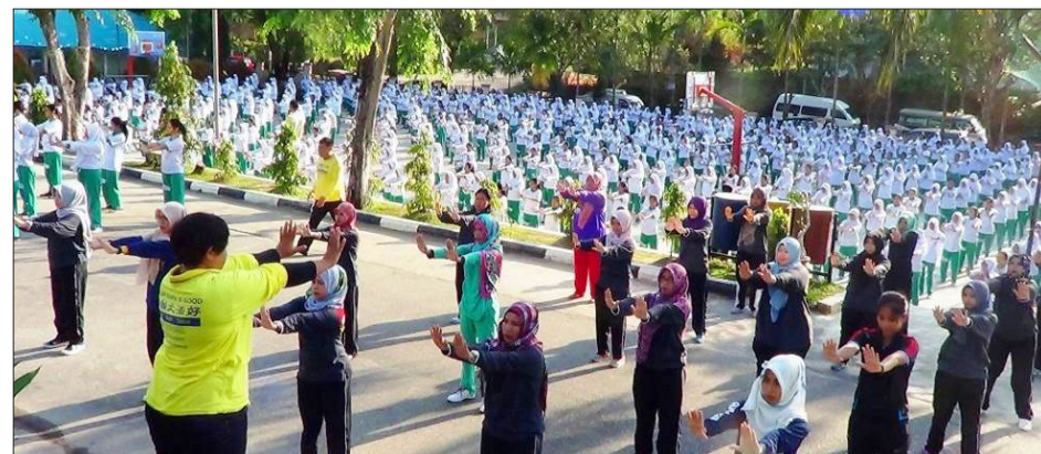
印度尼西亚 巴淡岛最受欢迎的两所中学——卡尔蒂尼高中和特拉丹第一中学 1700 多名师生学炼法轮功。

荣誉课程是美国大学专门给学术成绩最好、有学习动力的优秀大学本科生准备的，是内容更深、更广、更丰富的专门课程。这是继 2016 年 9 月开始的法轮大法修炼课程成人班之后的又一新课程。