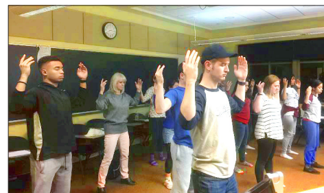
美国弥赛亚学院的学生炼法轮功

美国纽约州参议院于 2017 年 4 月全体通过 1432 号决议案，这也是纽约州参议院连续第七年通过表彰“世界法轮大法日”的决议案。决议案中说：“法轮大法为全球上亿人带来健康与内心的平静。”“法轮大法是在中国遭受迫害人群的力量源泉，尽管在她的起源地遭受