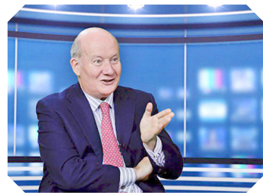
意大利学者因特罗维涅

中共 2017 年 12 月初在武汉召开“国际邪教问题研究学术论坛”。事后，新华社刊登英文文章称，中、美、加、澳、意大利、吉尔吉斯斯坦和斯里兰卡等国的约 30 位学者参加了论坛，并用这些人的身份污蔑法轮功。