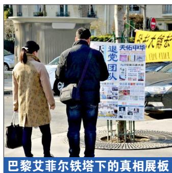
爱国不是爱党，中国不是中共。 右图：大陆游客在景点了解“退党保平安”的真相