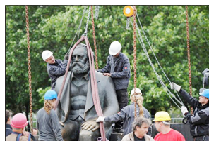
全球数千共产主义相关雕像被推倒、炸毁。图为德国工人正在移除柏林的一座马克思雕像。