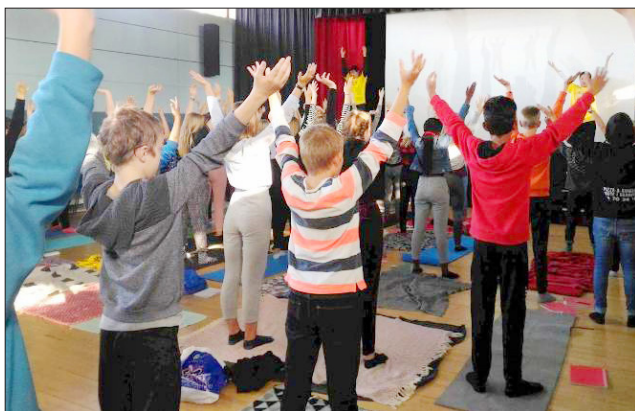
丹麦 国民学校的学生学炼法轮功

中共迫害法轮功之前，中国多所大学包括北大、清华有很多教授和学生修炼法轮功。今天，“真善忍”信仰受到海外师生的欢迎。