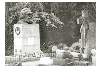
马克思葬身英国高门墓地，此地是撒旦（魔鬼）崇拜中心。

共产党的鼻祖马克思，是邪教信徒，这并非秘密，只是共产党国家故意忽视这一事实。莫斯科马克思学院称，马克思的作品有 100 卷之多，只有 13 卷被公开印发。