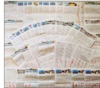
山东民众签名声援控告江泽民