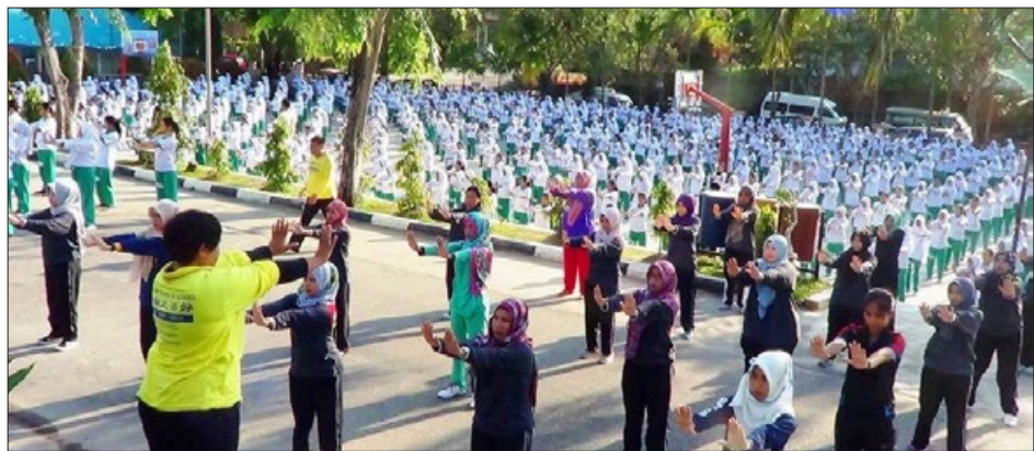
印度尼西亚 巴淡岛最受欢迎的两所中学——卡尔蒂尼高中和特拉丹第一中学 1700 多名师生学炼法轮功。

荣誉课程是美国大学专门给学术成绩最好、有学习动力的优秀大学本科生准备的，是内容更深、更广、更丰富的专门课程。这是继 2016 年 9 月开始的法轮大法修炼课程成人班之后的又一新课程。