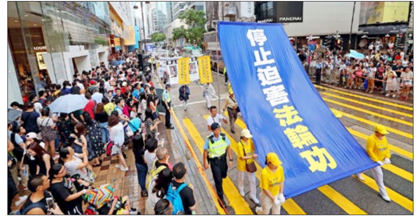
2017 年 10 月 1 日香港大游行，法轮功学员呼吁停止迫害，法办江泽民。

瑞士 50 多名国会议员和州议员于 2017 年 7 月在给联合国高级人权专员 Zeid Ra'ad Al Hussein 先生的呼吁信上签名，支持法办迫害法轮功的元凶江泽民，要求中共停止迫害法轮功。签名原件已递交联合国高级人权专员办事处。