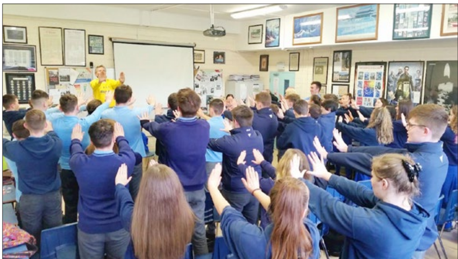
爱尔兰 都柏林 Malahide Community 中学将参加 2018 年高考的学生在炼法轮功。