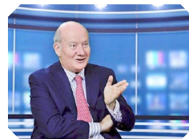
意大利学者因特罗维涅

中共 2017 年 12 月初在武汉召开“国际邪教问题研究学术论坛”。事后，新华社刊登英文文章称，中、美、加、澳、意大利、吉尔吉斯斯坦和斯里兰卡等国的约 30 位学者参加了论坛，并用这些人的身份污蔑法轮功。