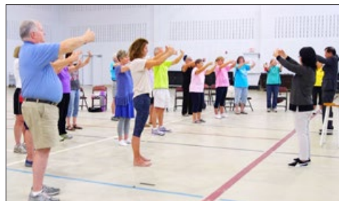
美国南卡罗莱纳大学艾肯分校成人班的学生在炼法轮功，左一是该校终身荣誉校长汤姆·豪尔曼博士。