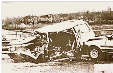
安女士的车祸现场照片。车祸让她昏迷一星期，随后则是 30 年的痛苦。（翻摄 1986 年报纸）