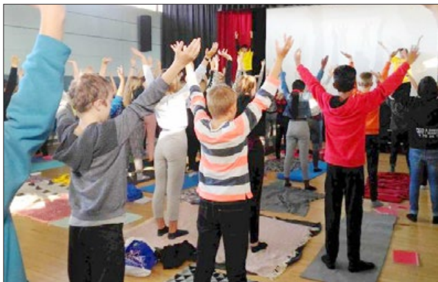
丹麦 国民学校的学生学炼法轮功

中共迫害法轮功之前，中国多所大学包括北大、清华有很多教授和学生修炼法轮功。今天，“真善忍”信仰受到海外师生的欢迎。