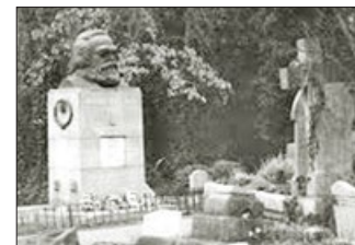
马克思葬身英国高门墓地，此地是撒旦（魔鬼）崇拜中心。

共产党的鼻祖马克思，是邪教信徒，这并非秘密，只是共产党国家故意忽视这一事实。莫斯科马克思学院称，马克思的作品有100卷之多，只有13卷被公开印发。马克思早年曾是基督徒，后加入魔教——撒旦教，马克思主义在其加入魔教后诞生。史料显示，列宁也是邪教信徒，他反对神，崇尚毁灭。