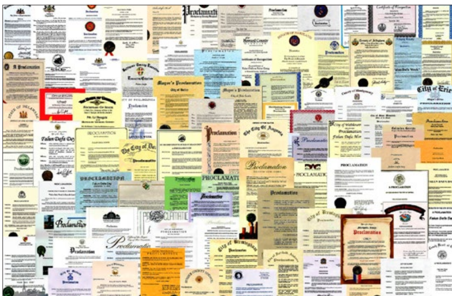
美国各级政府与政要往年给法轮功的褒奖