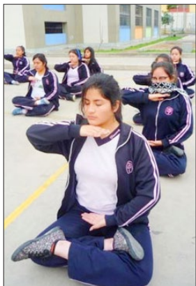
秘鲁 利马女中的学生炼法轮功