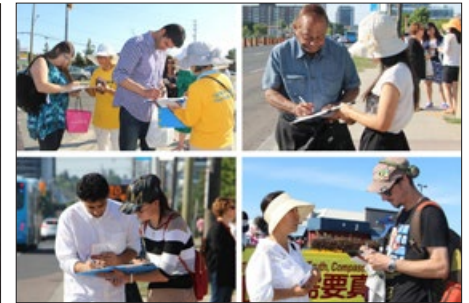
加拿大多伦多民众签名支持法办江泽民