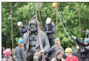
全球数千共产主义相关雕像被推倒、炸毁。图为德国工人正在移除柏林的一座马克思雕像。