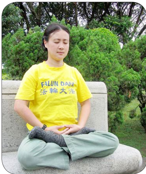
在纸醉金迷中找不到人生方向的雅惠， 修炼法轮功之后获得健康的人生。

雅惠发现自己思想观念的尘垢被一层层剥落，身心越来越轻快，思想也越来越清净。她说：“从开始看《转法轮》，我就没有再想