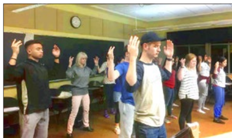
美国 弥赛亚学院的学生炼法轮功