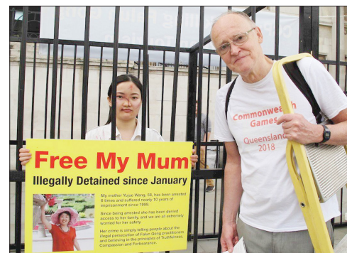
一位伦敦音乐人鼓励法轮功学员晓童

一位伦敦音乐人仔细聆听了法轮功学员被中共迫害的事实之后，写下了：正义必将战胜邪恶。◇