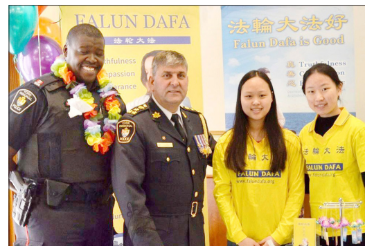
警察总长艾里克·乔里夫（左二）与法轮功学员

活动当天，约克区警察总长艾里克·乔里夫以及各级政府官员前来支持。警长来到法轮功的展位，与每个法轮功学员握手问候：“欢迎你们！谢谢你们！”警局督察瑞奇·维若潘先生说：“我们的职责是保护我们的社区、保护你们的权利、保护你们的信仰。法轮功在加拿大是受到保护的。”◇