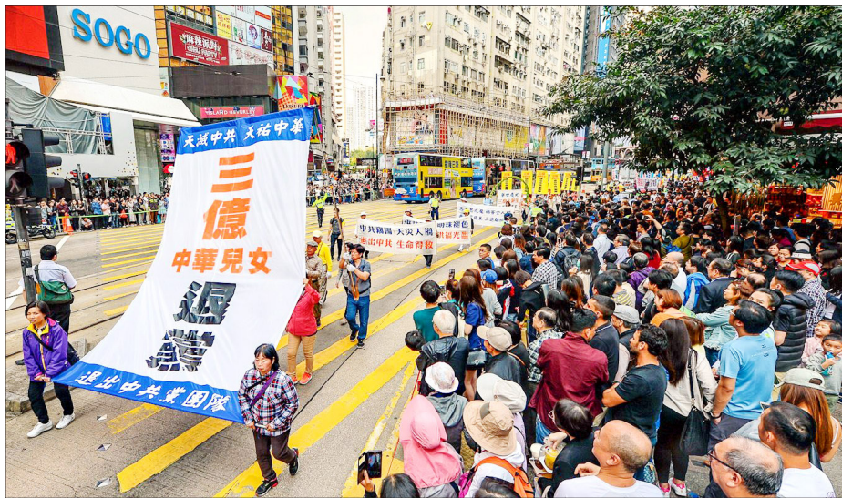
2018年3月18日，香港法轮功学员大游行，祝贺3亿中国人理智地选择未来。