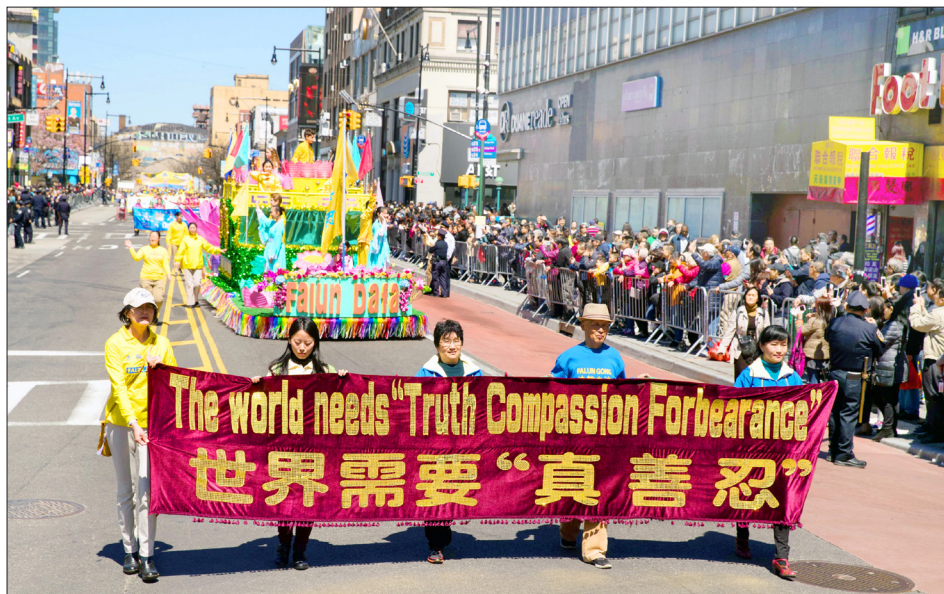
美国纽约大游行纪念“四·二五”和平上访 19 周年