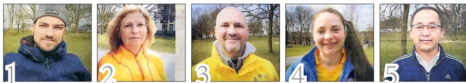
德国《鲁尔日报》报道法轮功并采访五位法轮功学员