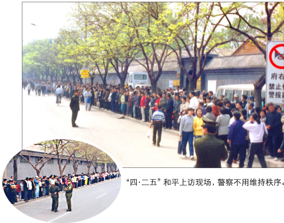
“四·二五”和平上访现场，警察不用维持秩序。