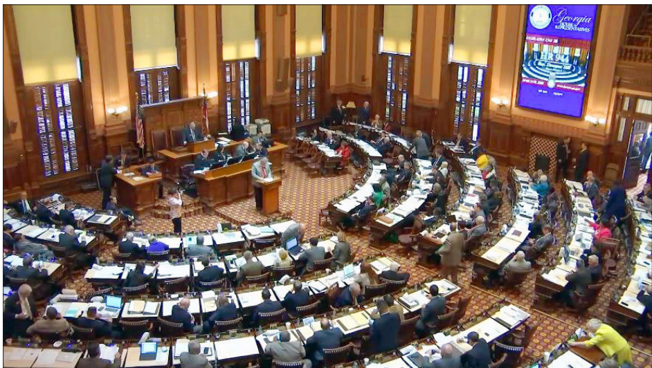
美国乔治亚州众议院一致通过 944 号决议案