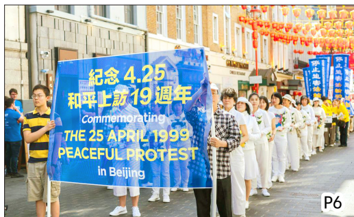
全球多地纪念“四·二五”和平上访 19 周年 (摄于伦敦唐人街, 2018 年 4 月 22 日)