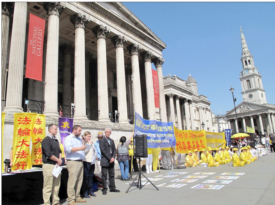
英国伦敦中使馆对面的新闻发布会，纪念“四·二五”和平上访19周年。此后，法轮功学员又举行大游行、传真相活动。