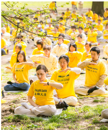
纽约的公园里，人们在炼法轮功的第五套功法。

弘传世界 法轮大法已弘传 100 多个国家和地区，受到世界人民的爱戴和尊敬。李洪志先生和法轮大法因对人类身心健康做出的杰出贡献，获各国政府褒奖、支持议案和信函 3500 多项。《转法轮》已经有 40 种文字版本并可在法轮大法网站 (falundafa.org) 免费下载。◇