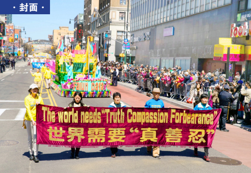
图：美国纽约大游行纪念“四·二五”和平上访 19 周年