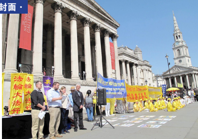
图：英国伦敦中使馆对面的新闻发布会，纪念“四·二五”上访 19 周年。