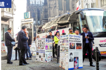
图：德国科隆大教堂前的广场上，中国大陆游客了解中共迫害法轮功的真相，以及为何要“三退”。