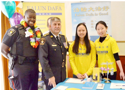
图：警察总长艾里克·乔里夫（左二）与法轮功学员