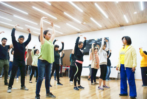
图：墨西哥联邦政府机构员工学炼法轮功