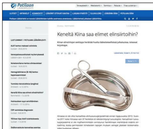
图：芬兰《患者医学杂志》刊文“谁从中国接受了器官移植”（网络版截图）