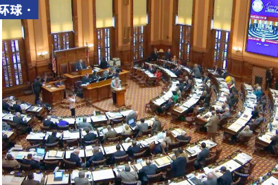
图：美国乔治亚州众议院一致通过 944 号决议案